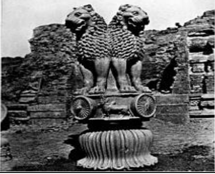
વૈશાલી ખાતે અશોક સ્તંભ.