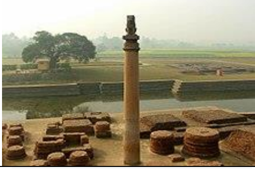
સારનાથમાં અશોક સ્તંભ. સી.એ. 250 બીસીઈ.