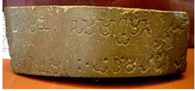
અશોક (238 બી.સી.ઈ.) ના 6 ફી પિલ્લરની રચના , બ્રહ્મી , સેંડસ્ટોન, બ્રિટિશ મ્યુઝિયમમાં ટુકડો