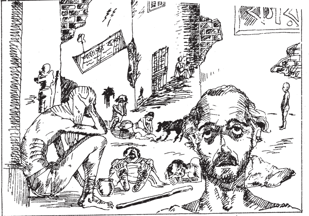
5. A. Famine Scene

અઢારમી સદીના મધ્ય ભાગથી ભારતમાં મોટી સંખ્યામાં વ્યાપક દુષ્કાળ પડ્યા હતા. ઉત્તર ભારતમાં 1759માં સિંધમાં, 1783માં ઉત્તર પ્રદેશ, 1837-38માં યુ.પી., પંજાબ, રાજસ્થાન દુષ્કાળમાં સપડાયાં હતાં. પશ્ચિમ ભારતમાં ગુજરાત અને મહારાષ્ટ્રના પ્રદેશો 1787, 1790-92, 1799થી 1804, 1812-13, 1819-20, 1824-25, 1833-34 દરમિયાન દુષ્કાળનો ભોગ બન્યા હતા. દક્ષિણ ભારતના પ્રદેશોમાં 1781-82, 1790-92, 1806-07, 1824-25, 1833-34 તથા 1853-55માં દુષ્કાળ પડ્યો હતો. પૂર્વ ભારતમાં દુષ્કાળનું પ્રમાણ ઓછું હતું; છતાં 1770માં બંગાળમાં પડેલો દુષ્કાળ આ સમયગાળા દરમિયાન સૌથી ભીષણ દુષ્કાળ હતો. બંગાળની ત્રીજા ભાગની વસ્તી - લગભગ એક કરોડ વ્યક્તિઓ - આ દુષ્કાળમાં મૃત્યુ પામી હતી.