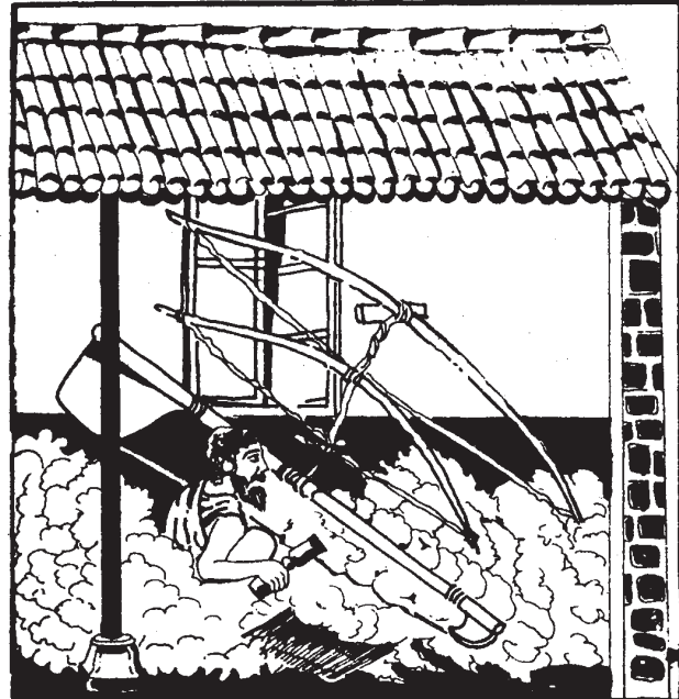
2 (A) Cotton cleaning

ભારતના સુતરાઉ કાપડની વધેલી માંગને કારણે કાપડઉદ્યોગના વિકાસને ઉત્તેજન મળ્યું. હિંદની વસ્તીનો મોટો હિસ્સો આ ઉદ્યોગમાંથી રોજગારી મેળવતો હતો. આ વેપારનું પલ્લું શરૂઆતમાં ભારતની તરફેણમાં નમતું હતું. પરિણામે સુતરાઉ કાપડના વ્યાપારમાંથી વિદેશોમાંથી મોટા પાયે સોનું, ચાંદી ભારતમાં ખેંચાઈ આવતું હતું. આ ગાળા દરમિયાન અમેરિકામાં મોટા પાયે કીમતી ધાતુઓ મળી આવી હતી અને યુરોપીય દેશોએ ત્યાંની ખાણો પર કબજો જમાવ્યો હતો. પરિણામે ભારતમાંથી થતી જથ્થાબંધ આયાતોની કિંમત ચૂકવવી શક્ય બની હતી. યુરોપના દેશો લગભગ ત્રણ સદી સુધી હિન્દ સાથેના વ્યાપારની આ અસમતુલિત સ્થિતિ અમેરિકાથી આયાત કરેલી સોના-ચાંદીને કારણે નિભાવી શક્યા હતા. વ્યાપારવાદની વિચારસરણીથી પ્રભાવિત થયેલા યુરોપના તત્કાલીન વિચારકો હિન્દ સાથેના વ્યાપારની આ અસમતુલાને અયોગ્ય ગણતા હતા અને પોતાના દેશોની નાણાકીય અસ્થિરતા માટે તેને જવાબદાર લેખતા હતા. યુરોપિયન કંપનીઓ દ્વારા એશિયાના દેશોમાં મોટા પાયે રવાના કરાતા કીમતી ધાતુના ખજાનાને કારણે તેઓ આ કંપનીઓની પ્રવૃત્તિના ઉગ્ર ટીકાકારો બન્યા હતા.