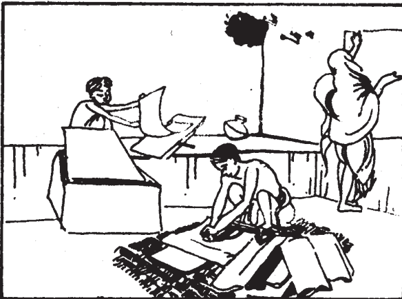
2 (D) Muslin-finishing