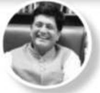
Piyush Goyal @PiyushGoyal

In line with PM Shri @narendramodi ji's vision to bring quick relief to the victims of road accidents & their immediate kin, 'Compensation to Victims of Hit and Run Motor Accidents Scheme', 2022 has been launched with multifold increase in compensation amount. #PragatiKahighway