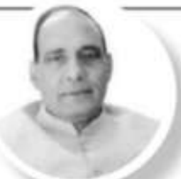
Rajnath Singh retweeted रक्षा मंत्री कार्यालय/ RMO India @DefenceMinIndia

दुनिया में शांति बरकरार रखनी है, तो राष्ट्रों की सुरक्षा अत्यंत आवश्यक है, और सुरक्षा के लिए उनका सैन्य रूप से मजबूत होना अत्यंत आवश्यक है। पिछले कुछ वर्षों में हमने ऐसा माहौल तैयार किया है, कि हमारी सेनाएं, scientists और defence manufacturers, pro-active तरीके से सोच सकें; RM