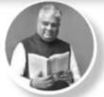
Bhopender Yadav @byadavbjp

Indian farmers are feeding the world. Egypt approves India as a wheat supplier. Modi Govt. steps in as world looks for reliable alternate sources for steady food supply. Our farmers have ensured our granaries overflow & we are ready to serve the world.