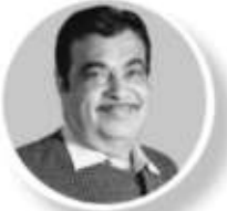
Nitin Gadkari @nitin_gadkari

क्योंकि देश का हर नागरिक अगर एक भी संकल्प ले तो 130 करोड़ संकल्पों का ये संपुट देश को महान बनाएगा।