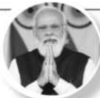
Narendra Modi @narendramodi

Through #MannKiBaat we celebrate the extraordinary feats of grassroots level change-makers. Do you know of such inspiring life journeys? Share them for this month's programme. Write on MyGov, NaMo App or dial 1800-11-7800 to record a message.