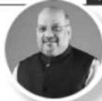
Amit Shah @AmitShah

दुनिया में शांति बरकरार रखनी है, तो राष्ट्रों की सुरक्षा अत्यंत आवश्यक है, और सुरक्षा के लिए उनका सैन्य रूप से मजबूत होना अत्यंत आवश्यक है। पिछले कुछ वर्षों में हमने ऐसा माहौल तैयार किया है, कि हमारी सेनाएं, scientists और defence manufacturers, pro-active तरीके से सोच सकें; RM