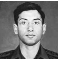
લેફ્ટનન્ટ મનોજકુમાર પાંડે

ઓપરેશન વિજય દરમિયાન 11 ગોરખા રાઈફલ્સની પ્રથમ બટાલિયનના લેફ્ટનન્ટ મનોજકુમાર પાંડેને જમ્મુ કાશ્મીરના બટાલિકમાં ખાલુબાર રિજને દુશ્મનોના કબ્જામાંથી ખાલી કરાવવાનું કામ સોંપવામાં આવ્યું. 3 જુલાઈ, 1999નાં રોજ તેમની કંપની જેવી આગળ વધી કે દુશ્મન સેનાએ તેમનાં પર આક્રમણ કરીને ચાર સૈનિકોને મારી નાખ્યા અને બે બંકરનો વિનાશ કરી દીધો. ખભા અને પગમાં ઈજા હોવા છતાં તેઓ પહેલાં બંકર પાસે પહોંચ્યા અને ભીષણ અથડામણમાં બાકીના બે સૈનિકોને મારીને બંકર ખાલી કરાવી દીધું. માથા પર જીવલેણ ઈજા થઈ તે પહેલાં પોતાની ટીમનું નેતૃત્વ કરતાં તેમણે એક પછી એક બંકર પર કબ્જો કરી લીધો. તેમનાં અદમ્ય સાહસથી પ્રોત્સાહિત થઈને તેમની ટીમના સૈનિકોએ દુશ્મન પર હૂમલો ચાલુ રાખ્યો અને અંતે પોસ્ટ પર કબ્જો કરી લીધો. અત્યંત ઉત્કૃષ્ટ શૌર્યપૂર્ણ કારનામાનું પ્રદર્શન અને સર્વોચ્ચ બલિદાન આપવા બદલ લેફ્ટનન્ટ મનોજકુમાર પાંડેને મરણોપરાંત પરમવીર ચક્રથી સન્માનિત કરવામાં આવ્યા. ●