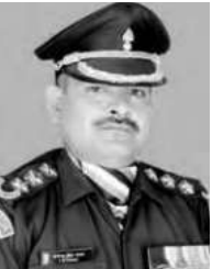
ગ્રેનેડિયર યોગેન્દ્રસિંહ યાદવ

કારગિલમાં ઓપરેશન વિજય દરમિયાન 18મી ગ્રેનેડિયર્સના ગ્રેનેડિયર યોગેન્દ્રસિંહ યાદવ ઘાતક પ્લેટૂનના સભ્ય હતા, જેને જમ્મુ કાશ્મીરના દ્રાસમાં ટાઈગર હિલ ટોપ પર કબ્જો કરવાનું કામ સોંપવામાં આવ્યું હતું. 3 જુલાઈ, 1999નાં રોજ દુશ્મનનાં ભારે ગોળીબાર વચ્ચે પોતાની ટીમ સાથે તેમણે બરફના પહાડ પર ચડાઈ કરી અને ત્યાંના બંકરને ઘ્વસ્ત કરી દીધું જેને કારણે પ્લેટૂનની એ પહાડ પર ચડવામાં સફળતા મળી. પેટના નીચનાં ભાગમાં અને ખભા પર ત્રણ ગોળી વાગવા છતાં અદ્યક્ષ સાહસનું પ્રદર્શન કરતા તેમણે બીજા બંકર પર હૂમલો કરીને તેને પણ તોડી નાખ્યું અને ત્રણ પાકિસ્તાની સૈનિકોને મારી નાખ્યા. તેમના આ સાહસભર્યા કારનામાથી પ્રેરાઈને પ્લેટૂનને નવું બળ મળ્યું અને અન્ય ઠેકાણા પર હૂમલો કર્યો અને અંતે ટાઈગર હિલ ટોપ પર પુનઃ કબ્જો કરી લીધો. આ સાહસ અને શૌર્યનું પ્રદર્શન કરવા બદલ ગ્રેનેડિયર યોગેન્દ્રસિંહ યાદવને પરમવીર ચક્રથી સન્માનિત કરવામાં આવ્યા.