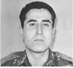
કેપ્ટન વિક્રમ બત્રા

કારગિલમાં 1999માં ઓપરેશન વિજય દરમિયાન 13 જેક રાઈફલ્સના કેપ્ટન વિક્રમ બત્રાને પોઈન્ટ 5140 પર