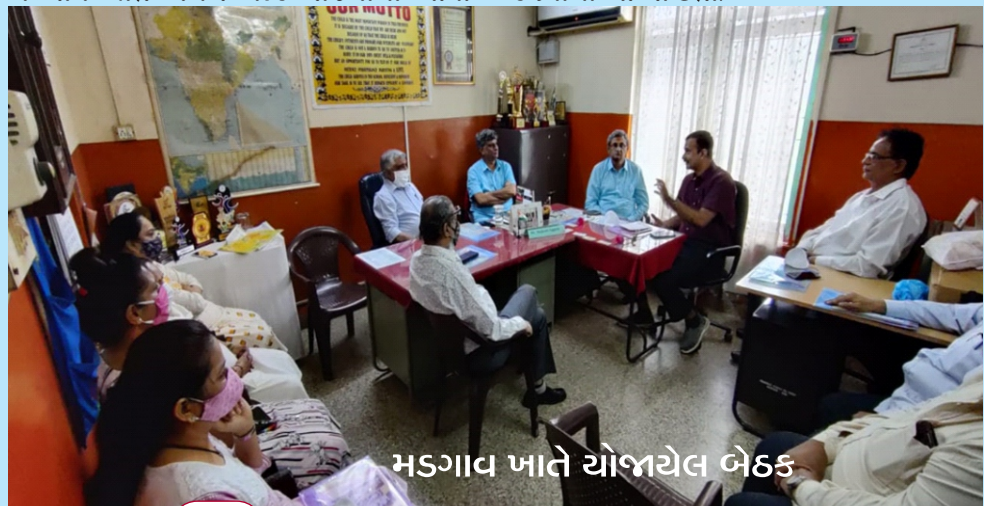
મડગાવ ખાતે યોજાયેલ બેઠક

NRG Meetના આયોજન માટે પણજી અને મડગાવ ખાતેની બંને બેઠકોમાં તમામ વિસ્તાર / જાતિના સમાજના હોદ્દેદારોએ રસ દાખવ્યો હતો અને સફળ બનાવવા સહકાર આપવાની પૂરી તૈયારી દાખવી હતી તે બદલ અધિક સચિવશ્રી (NRI), તથા નિયામકશ્રી (GSNRGF) દ્વારા સૌનો આભાર વ્યક્ત કરવામાં આવ્યો હતો.