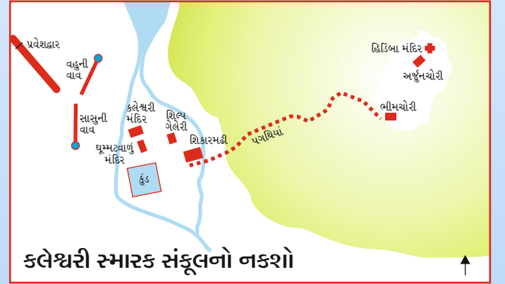
કલેશ્વરી સ્મારક સંકુલનો નકશો

શ્રાવણ માસમાં લોકો અહીં દર્શન કરવા દૂરદૂરથી આવે છે અને બાધા-માનતા માને છે. આ મેળો આદિવાસીઓ અને વિચરતી વિમુક્ત જાતિઓના વારસાને સમૃદ્ધ કરવા અને તેને વાચા આપવા માટે ઉજવવામાં આવે છે. કલેશ્વરીના આ પરંપરાગત મેળામાં