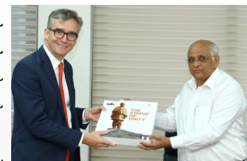
મુખ્યમંત્રી શ્રી ભૂપેન્દ્ર પટેલની સૌજન્ય મુલાકાત ભારત સ્થિત બ્રિટીશ હાઇકમિશનર શ્રી

એલેક્સ એસીસ અને ડેપ્યુટી હાઇકમિશનર શ્રી પીટર કૂકે ગાંધીનગરમાં લીધી હતી. બ્રિટીશ હાઇકમિશનરે ગુજરાતી સમુદાયોએ - ડાયસપોરાએ બ્રિટીશ-યુ.કે.ના વેપાર-વણજ ક્ષેત્રે મેળવેલી સિદ્ધિઓ અને યોગદાનની સરાહના કરતાં ગુજરાત-યુ.કે વચ્ચેના સંબંધોનો સેતુ વધુ સુઢઢ બનાવવાની હિમાયત કરી હતી. મુખ્યમંત્રીશ્રીએ પણ જણાવ્યું કે ઉચ્ચ અભ્યાસ માટે યુ.કે હંમેશા ગુજરાતના વિદ્યાર્થીઓ માટે પસંદગીનું સ્થળ રહ્યું છે.