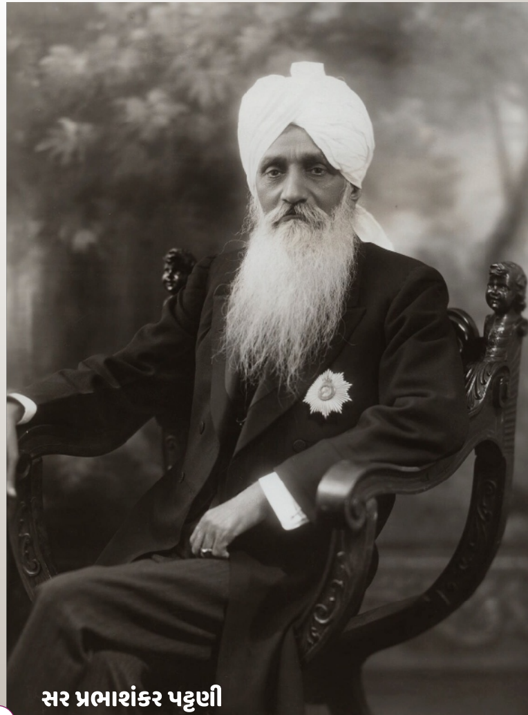
સર પ્રભાશંકર પટ્ટણી

પદભાર સંભાળ્યા બાદ માત્ર બે જ મહિનાના ટૂંકા ગાળામાં 'ભાવનગર દરબાર સેવીંગ્ઝ બેંક' સ્થાપના કરવામાં આવે છે. પટ્ટણી સાહેબની વિચક્ષણ કૂનેહ અને ભાવનગર રાજ્યના વહીવટની આંતરિક શક્તિના બળ ઉપર એક દિર્ઘદ્રષ્ટિભર્યા નિર્ણયથી ભાવનગર રાજ્ય તેના પર વીસ લાખનું દેવું હંતું તે ધ્યાનમાં રાખીને વીસ લાખ રૂપિયાના બોન્ડ બહાર પાડે છે. મહારાજા ભાવસિંહજી પાછળથી એક સમારંભમાં પટ્ટણી સાહેબની કાર્યપદ્ધતિ તથા નિર્ણય શક્તિને બિરદાવતા કહે છે કે સામાન્ય રીતે દેશી રાજ્યોની એવી આર્થિક શાખ હોતી નથી કે રાજ્યે બજારમાં મૂકેલી લોન-બોન્ડ બજારમાં ઉપડે. પરંતુ આપણાં રાજ્યની એકંદર સ્થિતિ તથા સર પટ્ટણી જેવા વહીવટદારની હાજરીથી હિન્દુસ્તાનમાં આપણી વિશ્વસનિયતા પ્રસ્થાપિત થઈ છે. આથી આ લોન ઓવર-સબસ્ક્રાઇબ થઈ! પછી મહારાજા ભાવસિંહજી ઉમેરે છે કે શ્રી પટ્ટણી આ સ્થિતિ માટે જવાબદાર છે, યશના અધિકારી છે. તે વાત કહેવામાં ભાવનગર રાજ્યના પ્રજાજનો આનંદ અનુભવે છે પણ હું તો તેને મગરૂખી માનું છું! કોઈ મહારાજાએ તેના દિવાનને આપેલી આવી ભવ્ય ભાવઅંજલી એ પણ ઇતિહાસની એક વિશિષ્ટ ઘટના છે. દુષ્કાળ સહિતના અનેક કારણોસર કથળેલી રાજ્યની આર્થિક સ્થિતિને ગણતરીના વર્ષોમાં જ સર પટ્ટણીએ પોતાના સામર્થ્યથી સંતોષકારક કક્ષાએ મૂકવાનું કામ કર્યું. આજે પણ વહીવટકર્તાઓ બંદરોનું યોગદાન નોંધપાત્ર રીતે સ્વીકારે છે ત્યારે આ હકીકત ૧૨૦ વર્ષ પહેલા સર પટ્ટણીને બરાબર સમજાઈ હતી. ભાવનગર રાજ્યને બ્રિટીશ શાસન પાસેથી બંદરીય વેપારના હક્કો મેળવી આપવાનો તેમણે કરેલો અવિરત સંઘર્ષ ઇતિહાસની એક ગૌરવપૂર્ણ ગાથા છે.