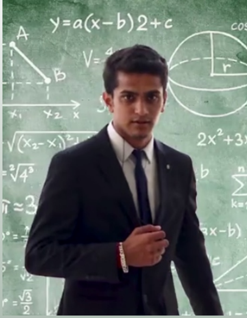
ગણિત ક્ષેત્રે અનોખી સિદ્ધિ મેળવનાર

ધૈર્યનું પહેલું પેપર વર્ષ ૨૦૧૮માં રજૂ થયું હતું. તેને ઇમ્પીરિયલ કોલેજ ઓફ લંડન તરફથી પેપર રજૂ કરવા માટે આમંત્રણ આપવામાં આવ્યું હતું. તેના છેલ્લાં બે રિસર્ચ પેપર નંબર ૯ અને ૧૦ બંને પેપર