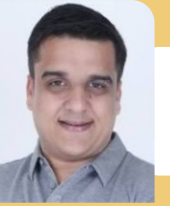
Shri Harsh Sanghvi Hon'ble Minister of State for NRGs (Independent Charge), Govt. of Gujarat