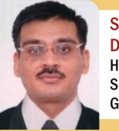
Shri Dhananjay Dwivedi, IAS Hon'ble Chairman, GSNRGF Secretary (NRI), Govt. of Gujarat