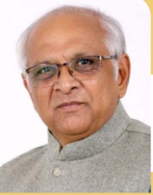
Shri Bhupendra Patel Hon'ble Chief Minister Gujarat State