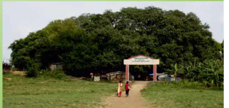
ભરૂચમાં નર્મદા કિનારે આવેલો પૌરાણિક કબીર વડ