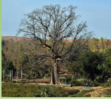
દાહોદના જૂના વડિયા ગામે બે સદી જૂનો શેમળો ઊભો છે

મહત્વના હેરિટેજ વૃક્ષો : લીમખેડા તાલુકાના જૂના વડિયા ગામના ખાંડીવાવ ફળિયામાં આવેલું શેમળાનું વૃક્ષ દાહોદનું 'વડીલ' છે. તેનો કુલ ઘેરાવો ૧૦.૮ મીટરનો છે. પડછંદ કાયા ધરાવતા ચારેક વ્યક્તિ માનવ સાંકળ રચે ત્યારે તેનું થડ માપી શકાય! શેમળાની ઊંચાઈ ૩૫ મીટર અંદાજવામાં આવી છે. બીજા શબ્દોમાં કહી તો શેમળાનું આ વૃક્ષ ત્રણચાર માળના એપાર્ટમેન્ટ જેટલું ઊંચું છે. આ વૃક્ષની ઉંમર ૨૦૦ વર્ષથી વધુ હોવાનો અંદાજ છે. ભાયલી પાસે આવેલા ગણપતપુરા ગામમાં ૮૦૦ વર્ષ જૂનું ૧૬.૫૦ મીટર ઘેરાવો