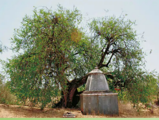
ગાંધીનગરના દેહગામના વદડ ગામે આવેલું વર્ષો જૂનું પીલુનું ઝાડ