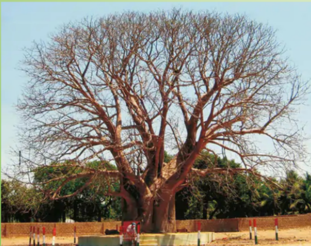
જૂનાગઢના માંગરોળ તાલુકાના હુસેનબાદ ગામે સૌથી મોટું રુખડા (બાઓબાબ)નું વૃક્ષ

ઝાડ હેરિટેજ છે તે કેવી રીતે નક્કી થાય છે? વન વિભાગ દ્વારા મહત્વના વૃક્ષોની યાદી તૈયાર થાય છે. પછી એક્સપર્ટ પેનલ દ્વારા વૃક્ષોના માપદંડ નક્કી થાય છે, જેમ કે, સૌથી મોટું વૃક્ષ, સૌથી વધારે આયુષ્ય ધરાવનાર વૃક્ષ, અસામાન્ય વૃક્ષ, આ પ્રકારની વ્યાખ્યામાં બંધબેસતા વૃક્ષોને હેરિટેજ જાહેર કરવામાં આવે છે. સદીઓથી અડીખમ ઊભેલું વૃક્ષ પણ હેરિટેજ ગણાય.