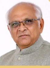
Shri Bhupendra Patel Hon'ble Chief Minister Gujarat State

Gujarat State Non-Resident Gujaratis' Foundation (A Government of Gujarat Organization)