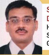
Shri Dhananjay Dwivedi, IAS Hon'ble Chairman, GSNRGF Secretary (NRI), Govt. of Gujarat