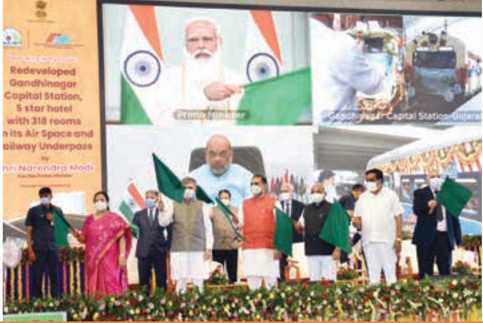
ગાંધીનગર રેલવે સ્ટેશન, સાયન્સ સિટીના ત્રિવિધ પ્રકલ્પ અને નવી ટ્રેનની ભેટ