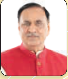
શ્રી વિજયભાઈ રૂપાણી મુખ્ય મંત્રીશ્રી