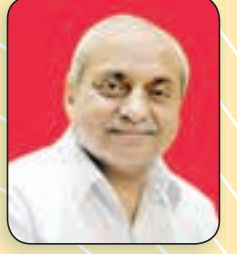
શ્રી નીતિનભાઈ પટેલ નાયબ મુખ્ય મંત્રીશ્રી