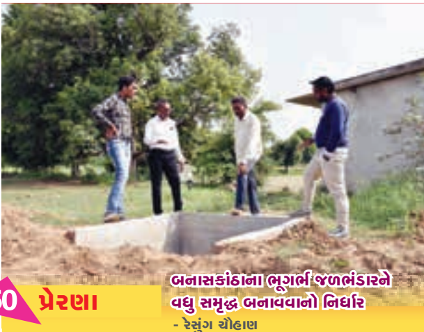
50 પ્રેરણા બનાસકાંઠાના ભૂગર્ભ જળભંડારને વધુ સમૃદ્ધ બનાવવાનો નિર્ધાર - રેસુંગ ચૌહાણ