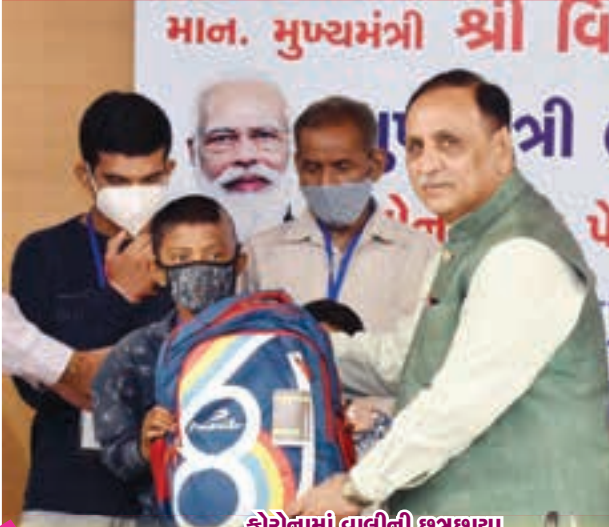
16 કવર સ્ટોરી કોરોનામાં વાલીની છત્રછાયા ગુમાવનાર બાળકો પ્રત્યેની સંવેદના : મુખ્યમંત્રી બાળ સેવા યોજના