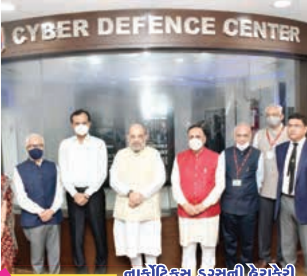
8 વિકાસગાથા નાર્કોટિક્સ ડ્રગ્સની ઠેરાફેરી અટકાવવા મક્કમ નિર્ધાર