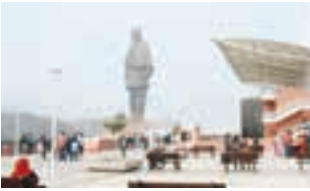
દુનિયાની સૌથી મોટી પ્રતિમા સ્ટેચ્યુ ઓફ યુનિટી કેવડિયા ખાતે