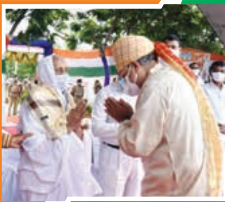
મંત્રી શ્રી સૌરભભાઈ પટેલ, રાજકોટ