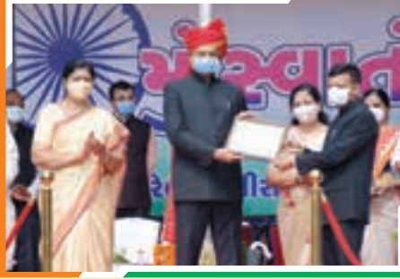
મંત્રી શ્રી પ્રદીપસિંહ જડેજા, વડોદરા