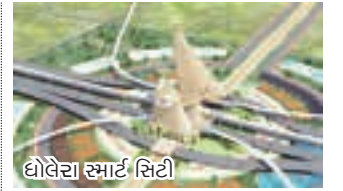
દોલેરા સ્માર્ટ સિટી