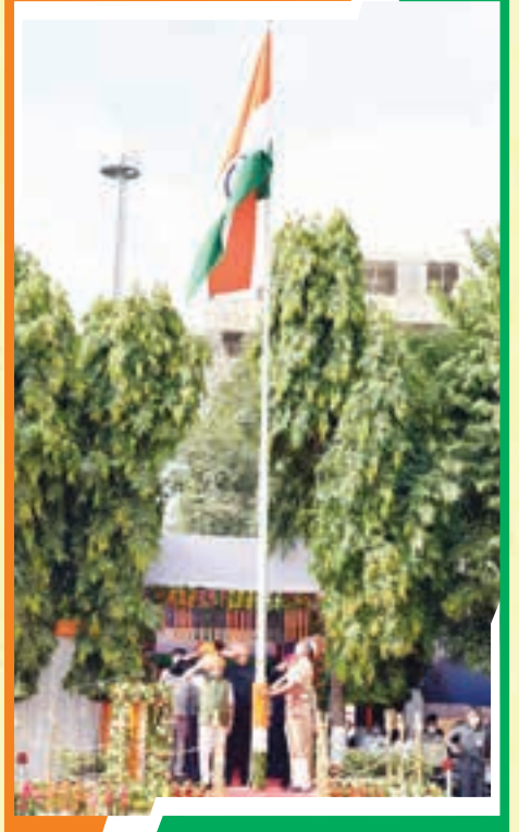
શ્રી નીતિનભાઈ પટેલ, નાયબ મુખ્ય મંત્રી, પંચમહાલ