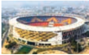
દુનિયાનું સૌથી મોટું ક્રિકેટ સ્ટેડિયમ ગુજરાતમાં