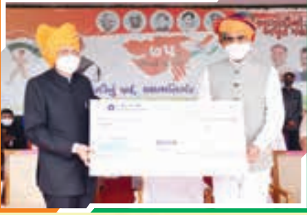
મંત્રી શ્રી દિલીપકુમાર ઠાકોર, ભરૂચ