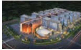
વિશ્વનું સૌથી મોટું કોમર્શિયલ કોમ્પ્લેક્સ ડાયમંડ પુર્સ સુરતમાં