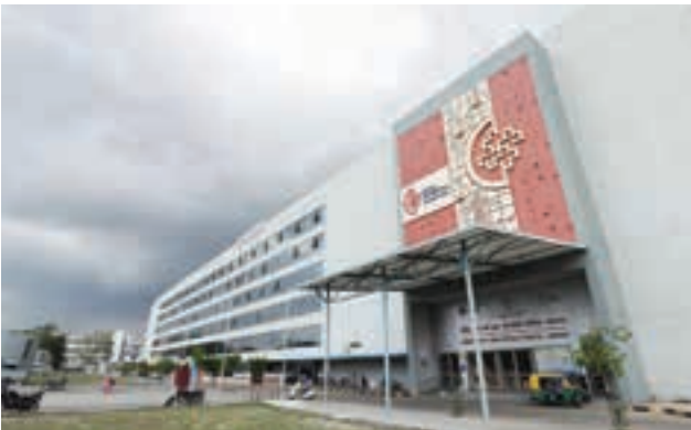
૧૨૧ એકરથી વધુ વિસ્તારમાં કાર્યરત સિવિલ હોસ્પિટલ થી લઈને સુપર હોસ્પિટલ સુપર સ્પેશિયાલીટી હોસ્પિટલોનું સંકુલ મેડીસિટી હોસ્પિટલ