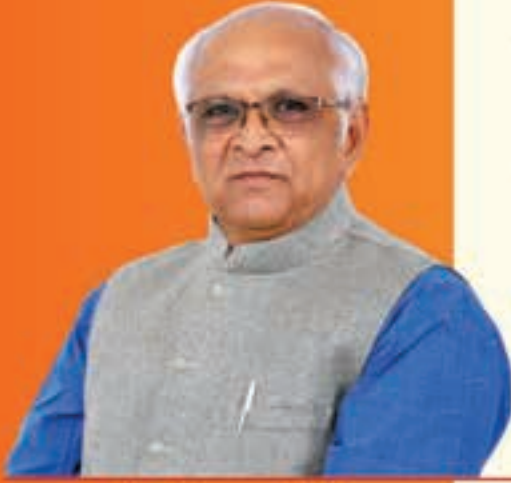
શ્રી ભૂપેન્દ્રભાઈ પટેલ મુખ્યમંત્રી, ગુજરાત

દુનિયાના સર્વાધિક લોકપ્રિય નેતા, દેશના લોકલાડીલા વડાપ્રધાન તેમજ