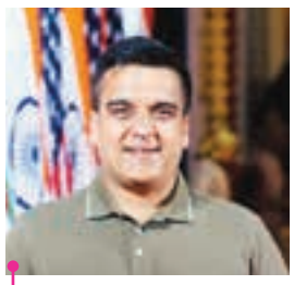
શ્રી હર્ષભાઈ રમેશકુમાર સંઘવી

રમતગમત, યુવક સેવા અને સાંસ્કૃતિક પ્રવૃત્તિઓ, સ્વૈચ્છિક સંસ્થાઓનું સંકલન, બિન નિવાસી ગુજરાતીનો પ્રભાગ, ગૃહરક્ષક દળ અને ગ્રામરક્ષક દળ, નાગરિક સંરક્ષણ, નશાબંધી, આબકારી, જેલ, સરહદી સુરક્ષા (સ્વતંત્ર હવાલો), ગૃહ અને પોલીસ હાઉસિંગ, આપત્તિ વ્યવસ્થાપન