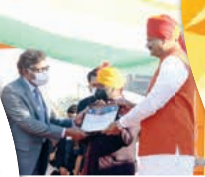
મંત્રી શ્રી જિતેન્દ્રભાઈ વાઘાણી રાજકોટ