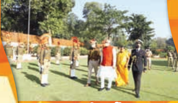
રાજ્યપાલ શ્રી આચાર્ય દેવવ્રતજી રાજભવન, ગાંધીનગર