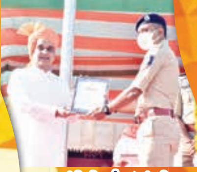
મંત્રી શ્રી હર્ષભાઈ સંઘવી ગાંધીનગર