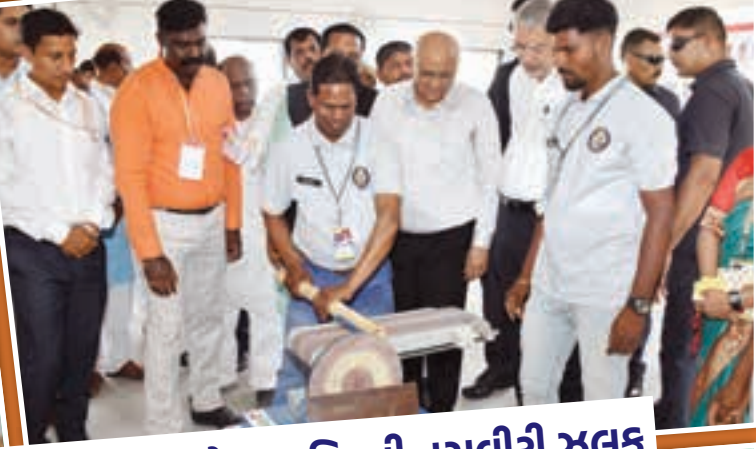
ડેડીયાપાડાના રૂલ મોલ, વાંસ વર્કશોપ, આયુષ આરોગ્ય કુટિરની તસવીરી ઝલક