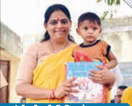
મંત્રી શ્રીમતી નિમિષાબેન સુથાર સંતરામપુર - મહીસાગર