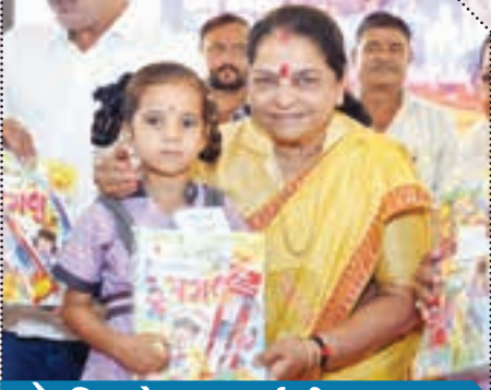
ડૉ. નિમાબેન આચાર્ય, વિધાનસભા અધ્યક્ષ ગાંધીધામ - કચ્છ