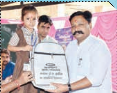
મંત્રી શ્રી અર્જુનસિંહ ચૌહાણ મહેમદાવાદ - ખેડા