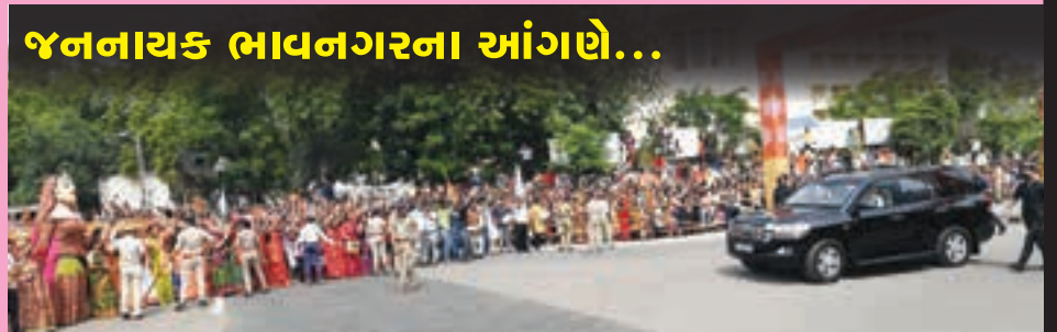
જનનાયક ભાવનગરના આંગણે...