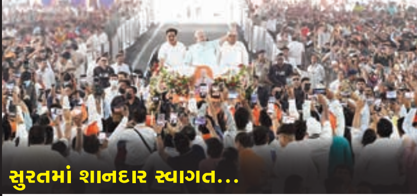
સુરતમાં શાનદાર સ્વાગત...