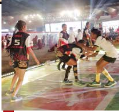
09 રમતોત્સવ - ખેલ મહાકુંભ