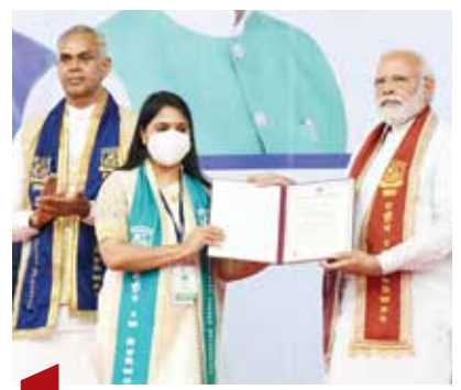
12 સુરક્ષા - રક્ષા યુનિવર્સિટી