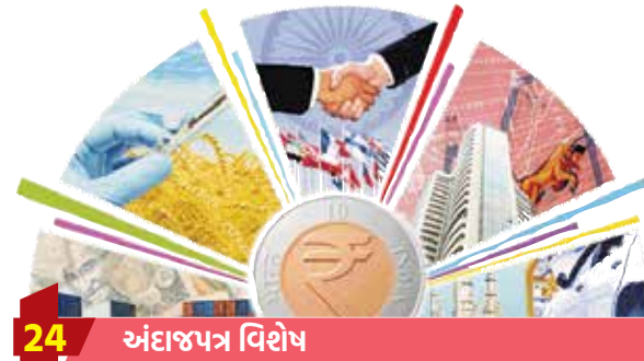
24 અંદાજપત્ર વિશેષ