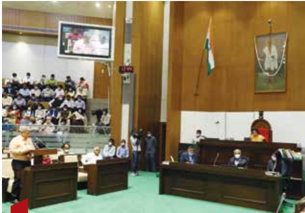
14 કવર સ્ટોરી સર્વજન હિતાય, સર્વજન સુખાયનો મંત્ર ચરિતાર્થ કરતું અંદાજપત્ર - 2022-23 - પુલક ત્રિવેદી

13 અંદાજપત્ર સુરાજ્યના સ્વપ્નને સાકાર કરતું ગુજરાત