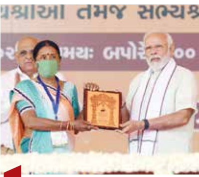
06 પંચાયતી રાજ