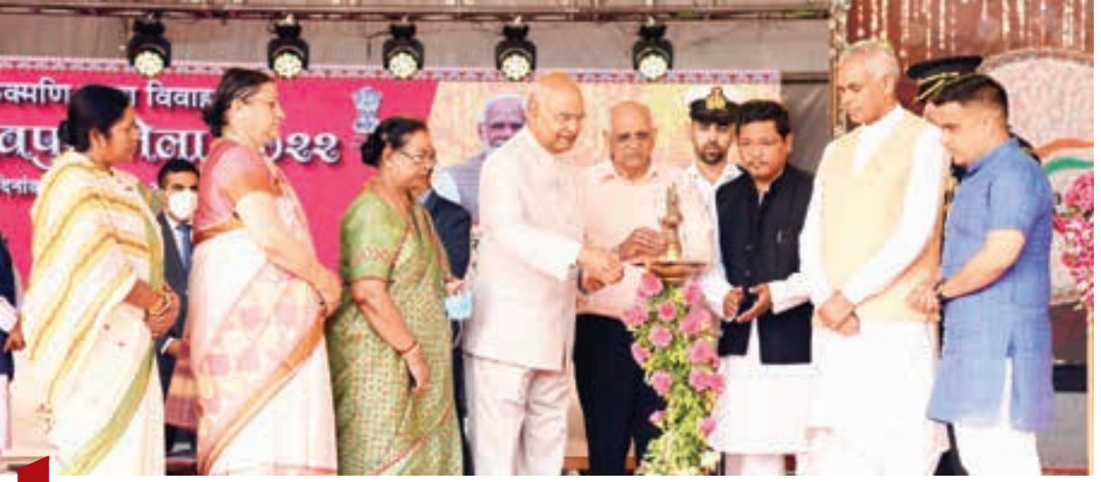
11 કવર સ્ટોરી માધવપુર ઘેડ મેળાને મળ્યું રાષ્ટ્રીય કક્ષાનું બહુમાન