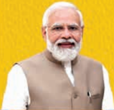
શ્રી નરેન્દ્રભાઈ મોદી વડાપ્રધાન

કેન્દ્ર અને રાજ્ય સરકારની વિકાસલક્ષી અને પ્રજાલક્ષી ગૌરવગાથા વિશેની 'ગુજરાત જ્ઞાન ગુરુ ક્વિઝ'