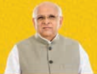
શ્રી ભુવેન્દ્રભાઈ પટેલ મુખ્યમંત્રી, ગુજરાત

કેન્દ્ર અને રાજ્ય સરકારની વિકાસલક્ષી અને પ્રજાલક્ષી ગૌરવગાથા વિશેની 'ગુજરાત જ્ઞાન ગુરુ ક્વિઝ'