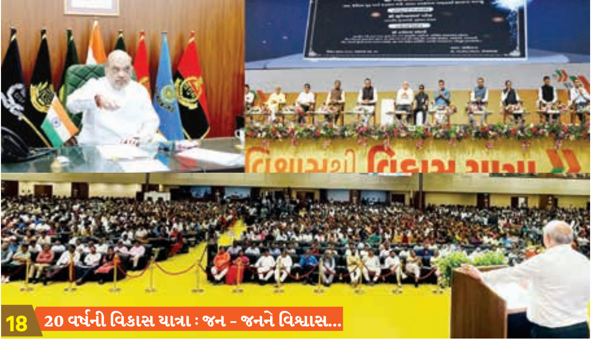
18 20 વર્ષની વિકાસ યાત્રા : જન - જનને વિશ્વાસ...