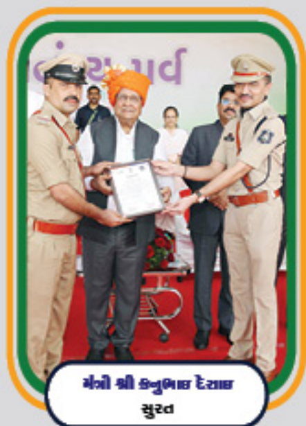
મંત્રી શ્રી કનુભાઈ દેસાઈ સુરત