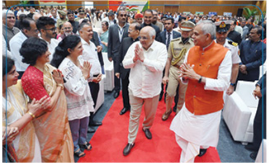
૭૭ માં સ્વાતંત્ર્ય પર્વની સંધ્યાએ રાજભવન સંકુલમાં નવનિર્મિત મહર્ષિ દયાનંદ સભામંડપમાં સૌપ્રથમ વખત ઐતિહાસિક ‘એટ હોમ’ કાર્યક્રમનું ભવ્ય અને દિવ્ય આયોજન કરવામાં આવ્યું હતું, જેમાં રાજ્યપાલ શ્રી આચાર્ય દેવવ્રત અને મુખ્યમંત્રી શ્રી ભૂપેન્દ્રભાઈ પટેલે સ્વાતંત્ર્ય પર્વે રાજ્યના આગેવાનો, નાગરિકો સાથે શુભેચ્છાઓની આપ-લે કરી હતી.